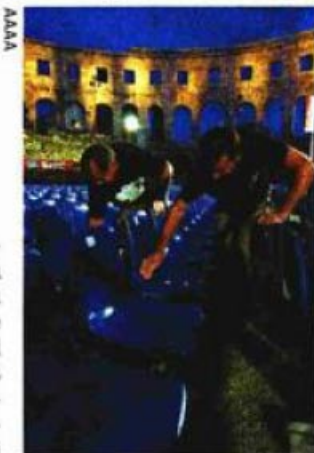
U Puli uključeno 300 ljudi

I dok većina od devet hrvatskih gradova kandidata za europsku prijestolnicu kulture kriju svoje prijavne knjige kao zmija noge, grad Varaždin cijeli je dokument ove subote objavio na internetu. Svoj su opsežni kandidacijski dokument tiskali i u dvije tisuće primjeraka